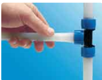
3. Suruge toru liitmiku peale – valmis! Uponor Q&E PPSU-liitmik