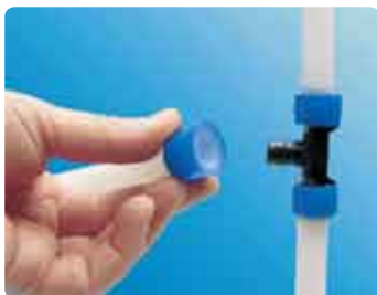
1. Asetage torule Uponor Q&E rõngas.