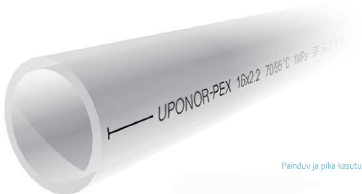
Painduv ja pika kasutuseaga: Uponori PE-Xa toru

Meie PE-Xa toodete valmistamine on jaotatud Uponori tootmisüksuste vahel Rootsis, Hispaanias, Kanadas ja USA-s.