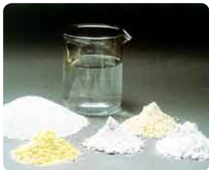
Ei mingeid kompromisse – toormaterjalid alati kõrge kvaliteediga.