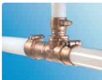
4. Uponori klamberkolmik