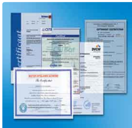
Uponor PE-Xa torude süsteemil on olemas Saksamaa DVGW ja teiste rahvusvaheliste asutuste sertifikaadid, kokku 80 sertifikaati, nt ABS Europe Ltd., CSTB, DIN CERTCO, DVGW, KIWA N.V.

Sel põhjusel saame anda teile 10-aastase süsteemigarantii, mida toetab rahvusvaheline kindlustusfirma. Kui paigaldamisel kasutatakse segamini erinevatest allikatest pärinevaid liitmikke ja torusid, siis Uponori süsteemigarantii ei kehti.