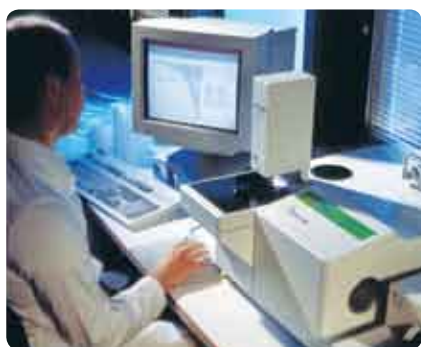
Järeleproovitud ja kontrollitud tooted tagavad järjekindla kvaliteedi.