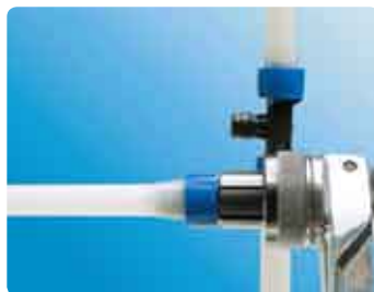
2. Laiendage toru laiendiga.