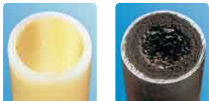
Uponor PE-Xa torude puhul ei teki korrosiooni ega katlakivi.